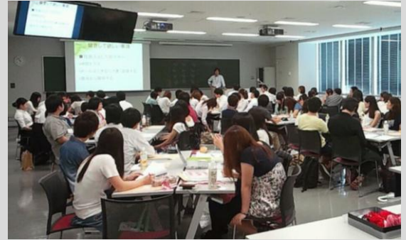
昨年、東京を会場に開催された同様の研修の様子