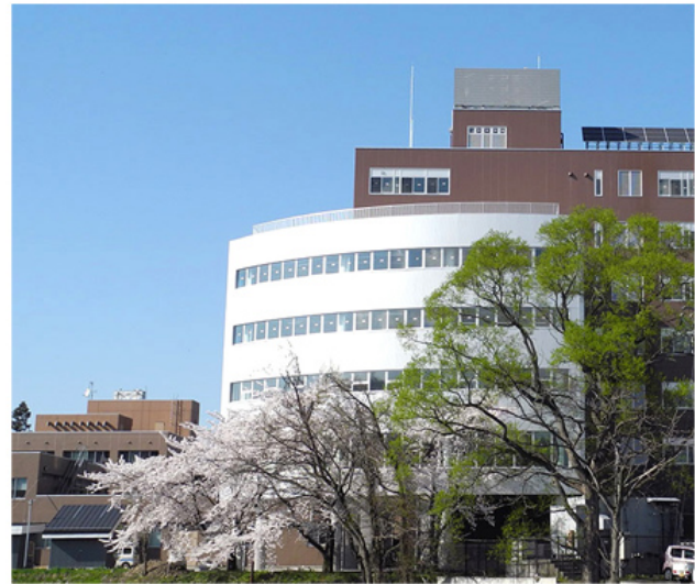
有機材料システムフロンティアセンター (FROM) : 11号館